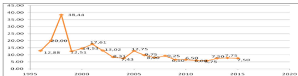
Gambar 1. Grafik Tingkat Inflasi di Provinsi Aceh Periode 1996-2015

Sumber: Data diolah (Bank Indonesia, 2016)