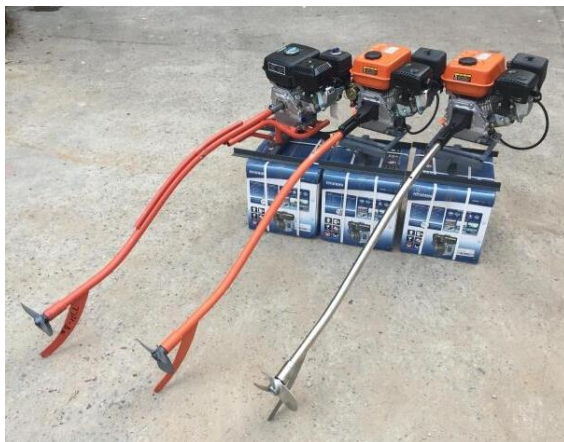
Gambar 1. Motor penggerak dan baling-baling[8]

Baling-baling (propeller) merupakan salah satu komponen yang dipasang pada kapal nelayan yang digerakkan oleh motor diesel sebagai penggerak mula. Prinsip kerja motor diesel menggerakkan baling-baling melalui kopling dan poros baling-baling, sehingga baling-baling berputar menghasilkan gaya dorong maju atau mundur (Gambar 1) [7].