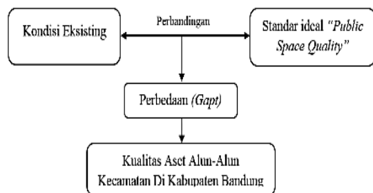
Gambar 2. Model Penelitian

Analisis dalam penelitian ini dilakukan dengan cara membandingkan antara kondisi eksisting aset dengan standar ideal alun-alun yang mengacu pada public space quality sehingga ditemukannya perbedaan ( gap ) dari kedua hal tersebut sehingga dapat diketahui kualitas aset pada alun-alun. Dari hasil penelitian tersebut dapat diketahui permasalahan kualitas aset pada alun-alun kecamatan Kabupaten Bandung sehingga perlu adanya upaya perbaikan berupa renovasi aset. Berikut ini disajikan gambaran model penelitian yang digunakan dalam penelitian ini.