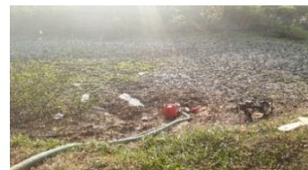
Gambar 2. Pompa sederhana untuk mengambil air tanah

Dikarenakan air tidak mengalir ke areal persawahan, serta tidak diketahui titik ujung dari aliran air irigasi maka petani di sekitar embung menggunakan pompa yang lebih sederhana untuk mengambil air tanah agar dapat dialirkan ke sawah. Berikut tampak dari pompa tersebut.