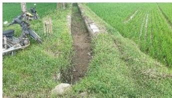
Gambar 3. Saluran Primer

Saluran primer pada jalur irigasi ini terbuat dari tembok dengan lebar 110 cm dan kedalaman 70 cm. Panjang dari saluran primer yakni 175 m. Saluran ini teraliri air dari pompa yang disalurkan dengan pipa paralon. Saluran sekunder pada jalur irigasi berjumlah lima saluran. Kelima saluran ini terdapat bagian yang terbuat dari tembok, ada juga bagian yang terbuat dari tanah. Jalur irigasi Cibanggala tidak memiliki saluran pembawa yang membawa air irigasi dari sumber lain selain sumber utama yakni Sungai Cilamaya. Pada jalur irigasi ini tidak memiliki saluran muka tersier karena tidak terdapat bangunan sadap tersier serta petak tersier.