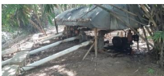
Gambar 1. Pompa yang digunakan oleh petani

Bangunan jalur irigasi terbuat dari material gundukan tanah yang dibentuk seadanya oleh petani. Selain itu, bangunan utama hanya berupa pompa yang digunakan untuk mengambil air dari Sungai Cilamaya yang selanjutnya dialirkan ke areal persawahan. Berikut tampak dari pompa tersebut.