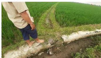
Gambar 4. Saluran sekunder yang dilubangi

Kondisi di lapangan, jalur irigasi ini tidak memiliki saluran tersier. Tetapi, terdapat saluran air yang tidak disalurkan dari bangunan bagi, melainkan dari saluran sekunder yang dilubangi.