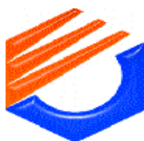
Gambar 1. Logo dari Politeknik Negeri Bandung

Dalam penulisan hasil eksperimen biasanya menampilkan gambar (grafik atau ilustrasi). Judul Gambar ( times 11 ) diletakkan di bawah Gambar terpusat di tengah dengan huruf tegak. Gambar dapat mengisi satu kolom atau dua kolom penuh. Letak gambar berada ditengah kolom. Penomoran Gambar harus berurutan. Untuk gambar silakan mengikuti petunjuk seperti terlihat pada Gambar 1.